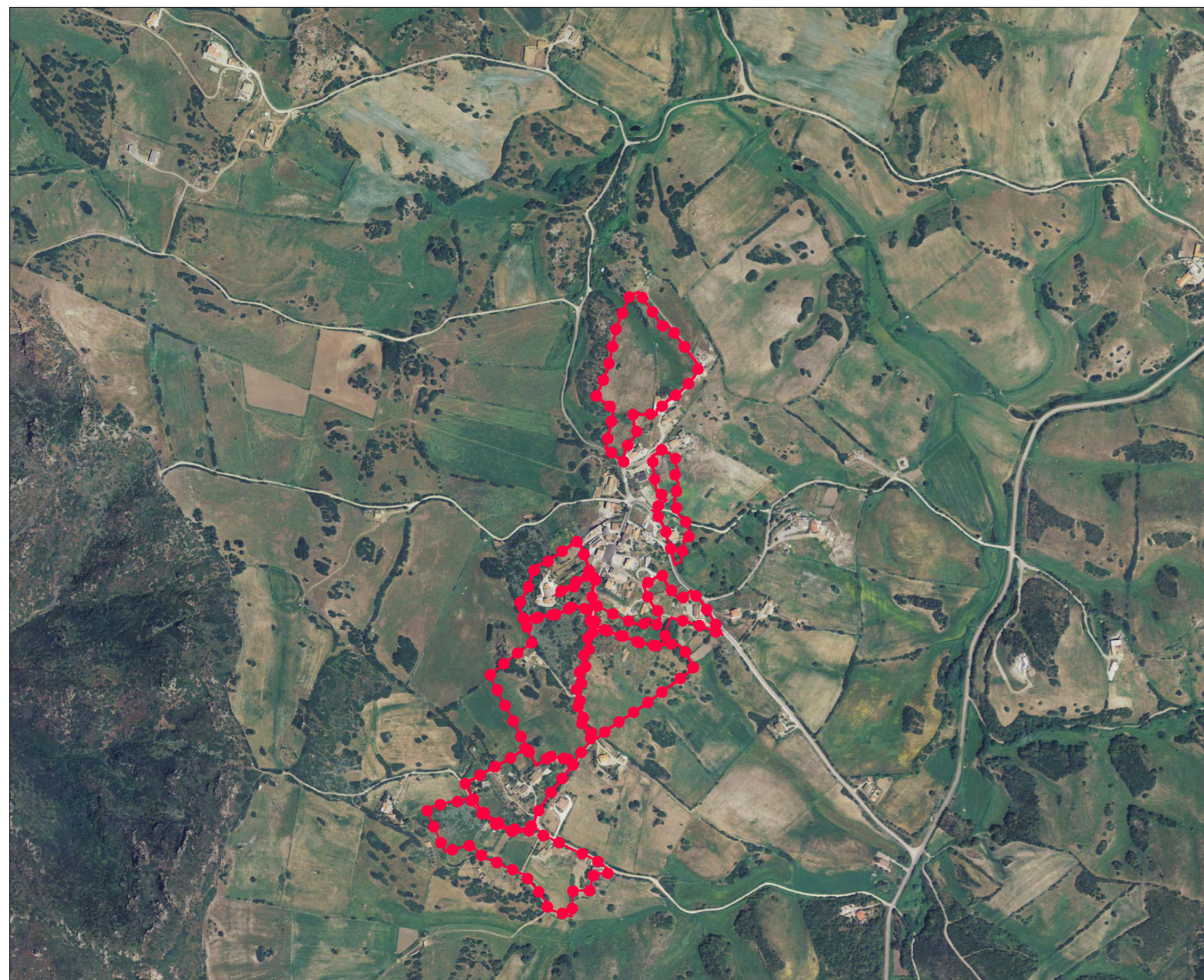
IMMAGINE AEREA Scala 1:10.000