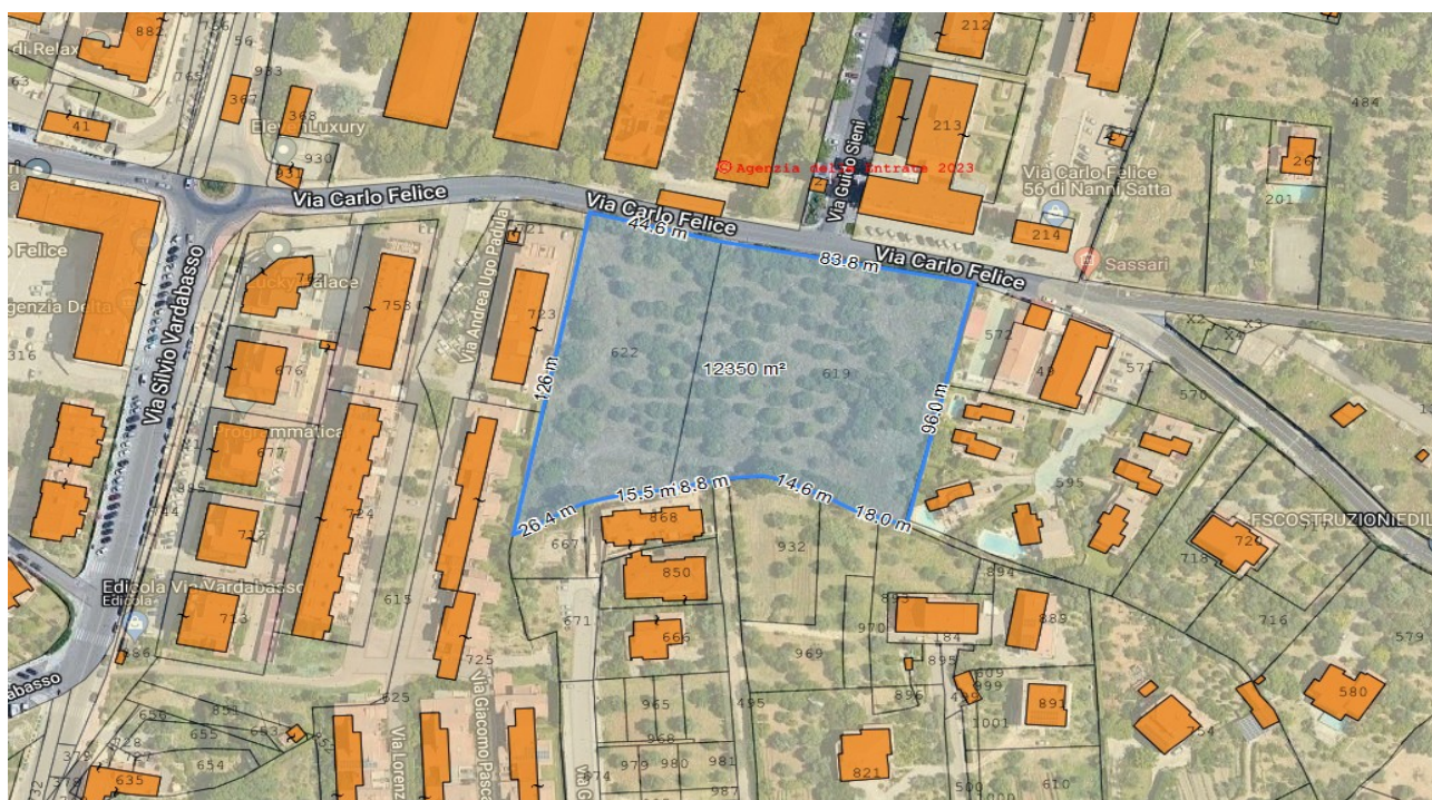
Planimetria catastale con area lotto

Settore Cultura, Sviluppo Turistico e Gestione del Patrimonio Immobiliare Servizio Patrimonio