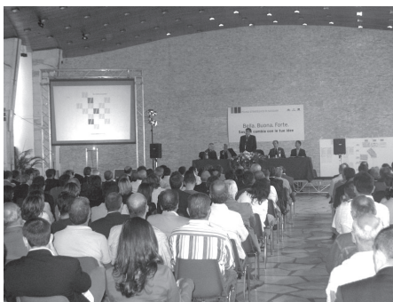
...e il pubblico dell'ultimo giorno

Il momento forse più importante dell'intera Settimana è stato registrato l'ultimo giorno, quando sono state presentate le linee guida del nuovo Piano Urbanistico Comunale. Da 20 anni, ha ricordato Ganau, si parla di Piano urbanistico, la cui assenza ha purtroppo provocato un disordine nello sviluppo della città: basti pensare al fenomeno Predda Niedda e al disastro nell'agro con un'area di residenze diffuse che si estende sino ad oltre 40 chilometri dalla città e che rende impossibile garantire i servizi essenziali come acqua, luce e fognature. Non mancano però nuove zone di espansione: i parchi urbani di Sant' Orsola, Li Punti e Rosello;