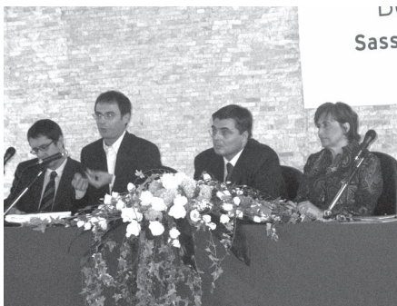
I relatori della prima giornata...