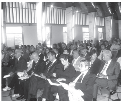
Gli "spettatori" delle "5 giornate"