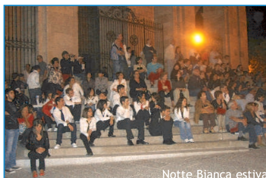
Notte Bianca estiva