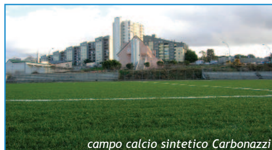
campo calcio sintetico Carbonazzi