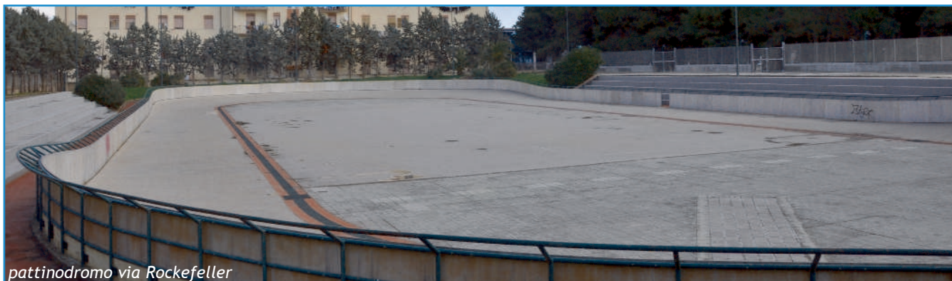
pattinodromo via Rockefeller