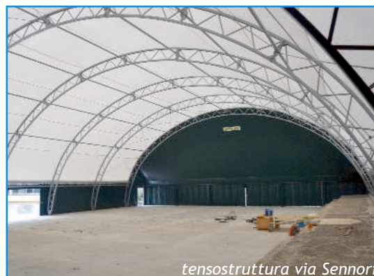
tensostruttura via Sennori