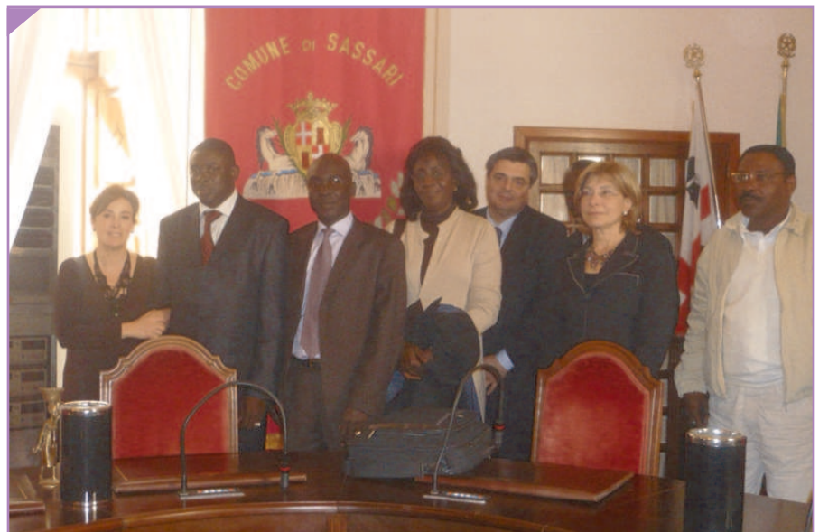
Febbraio 2009: delegazione di Pikine in visita a Sassari

Capo di Gabinetto del Comune di Pikine, dal Direttore Affari Sanitari, Sociali ed Educativi del comune senegalese, dal Direttore dei Servizi tecnici e dalla direttrice dell’ospedale della città. Il progetto permette la costruzione di un ponte tra la Sardegna e il Senegal per facilitare l’inserimento lavorativo o comunque l’avvio di attività imprenditoriali nei territori coinvolti nel progetto.